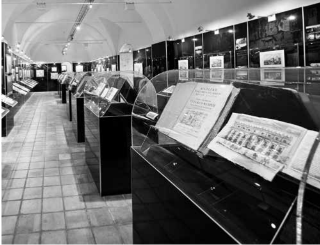
[Fig. 1 – Palazzolo Acreide, Museo dei Viaggiatori in Sicilia, sala espositiva].