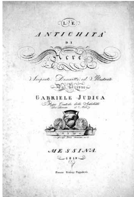
[Fig. 5 – Gabriele Judica, Le antichità di Acre , Messina 1819, frontespizio].