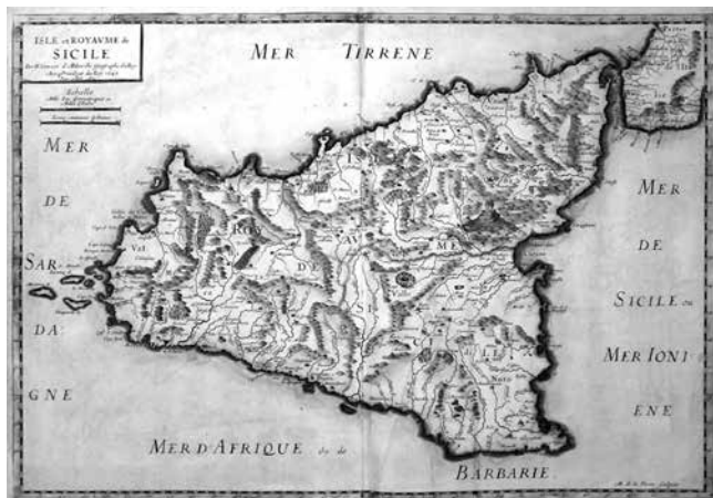
[Fig. 4 – Nicolas Sanson d’Abbeville, Isle et Royaume de Sicile , 1647, incisione acquerellata].