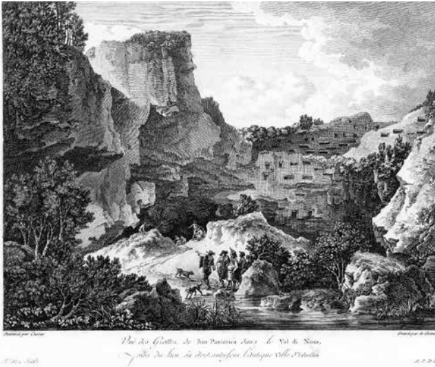
[Fig. 2 – “Veduta delle Grotte di San Pantarica nel Val di Noto ripresa dall’uogo dove un tempo era l’antica città d’Erbesus”, Tav. 129 de Saint Non (disegno Casas, incisione de Ghendt), vol. IV.2, 1786, incisione all’acquaforte].