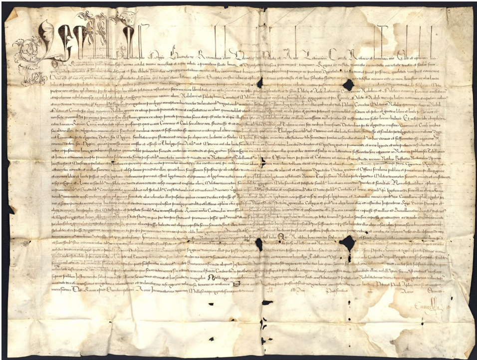
Abb. 2 Comitive für Benedetto Rizzoni (1514 Mai 1); Verona, Archivio di Stato, VIII Varii, Perg., Rizzoni, b. I, perg. 25 (Concessione n. 21/2014 prot. 6298 cat.28.13.10/1)

Nicht alle Namen können hier einzeln vorgestellt werden. Hervorgehoben seien immerhin zwei prominente Kuriale: der Deutsche – als Pfründenjäger berüchtigte – Johannes Ingenwinkel 66 und der Favorit des Papstes Girolamo de Arsago, später Bischof von Nizza, der ebenfalls 1507 zum comes palatinus erhoben wurde 67 .