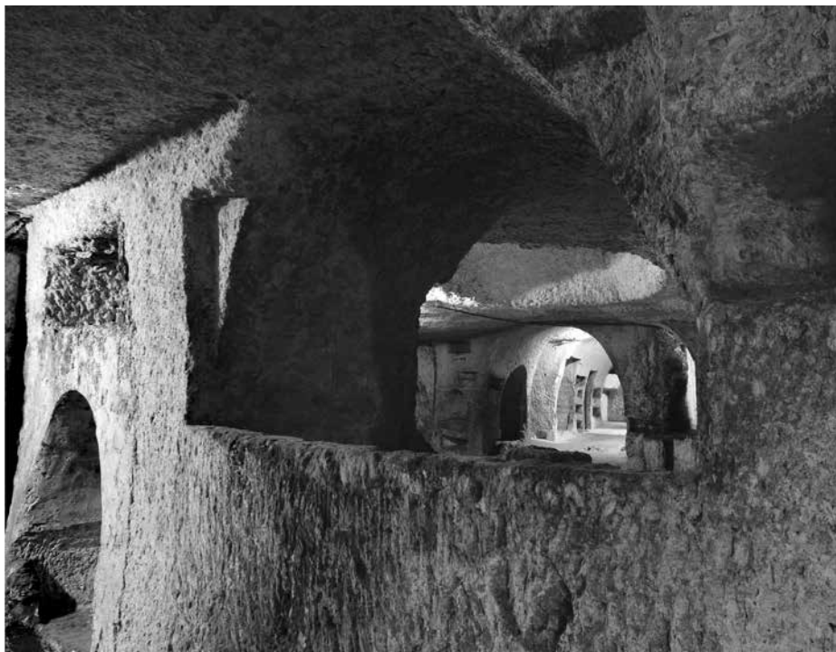
Figura 1. Siracusa. Catacombe di San Giovanni. Decumano minore.

del vescovo Siracoso. Secondo la più accreditata interpretazione del testo, Marina potrebbe essere la moglie del patricius et magister militum Sabinianus , inviato in Spagna dall'imperatore Onorio al tempo delle invasioni barbariche in una data presumibilmente compresa fra il 409 e il 423 8 . Questa data concorderebbe con numerose testimonianze di epigrafi datate con l'indicazione della coppia di consoli in carica nell'anno della morte, testimonianze riconducibili agli anni degli imperatori Arcadio e Onorio nel primo venticinquennio del V secolo e che sembrerebbero suggerire una connessione tra alcune sepolture della regione meridionale e la diaspora degli aristocratici da Roma in seguito all'avanzata di Alarico nel 410, che si rifugiarono in Sicilia e in Africa come in altre province dell'Impero 9 .