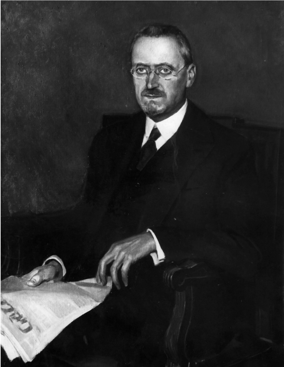
Fig. 3. Ritratto di Luigi Schiaparelli del pittore Guglielmo Ghini, 1933.

389, del 26 ottobre del 1915, in cui Cipolla diede un sunto dell'ultimo corso che aveva tenuto a Firenze dettandolo alla figlia, come si evince da un confronto con la grafia della lettera che chiude l'epistolario (n. 414 del 18 novembre 1916), in cui quest'ultima comunicò allo Schiaparelli che il padre pochi giorni prima