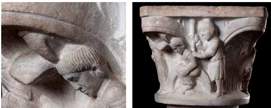
Figura 3. Il martirio di san Pimeneo e la mano di Dio (particolare). Brescia, Museo di Santa Giulia, < http://www.turismobrescia.it/it/punto-d-interesse/capitello-figurato-con-la-crocifissione-di-santa-giulia >.

bolo incongruente: può essere interpretato, infatti, come segno dell'esenzione dall'autorità vescovile di cui godeva il monastero. Letto in questo modo, è un segno che indica una realtà anteriore alla Riforma del secolo XI, certamente precedente alle fine del secolo XII - primi del XIII, che furono gli anni del papato di Innocenzo III e che coincidono con il periodo cui è attribuita la fattura