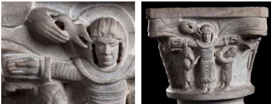
Figura 2. La crocifissione di santa Giulia e la mano di Dio (particolare). Brescia, Museo di Santa Giulia, < http://www.turismobrescia.it/it/punto-d-interesse/capitello-figurato-con-la-crocifissione-di-santa-giulia >.