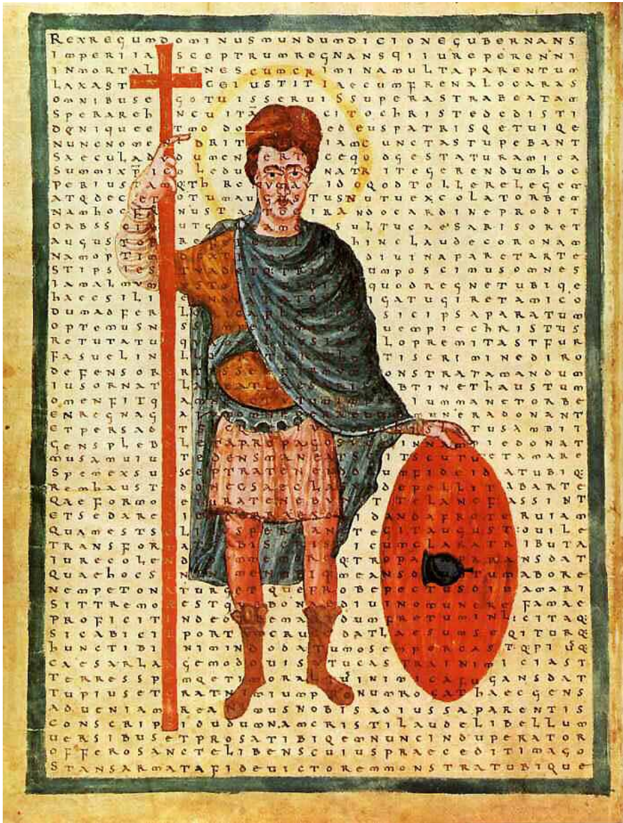
Figura 11. Ludovico il Pio, miles Christi . Biblioteca Apostolica Vaticana, Ms. Reg. lat. 124, f.4v, < https://it.wikipedia.org/wiki/Ludovico_il_Pio#/media/File:Ludwik_I_Pobo%C5%BCny.jpg >.