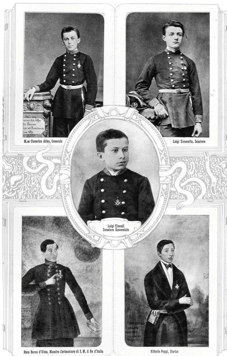
Fig. 1 bis - I «Principi dell'Accademia» più noti dell'Istituto dei P.P. Scolopi di Savona, da Reale Collegio Scuole Pie Savona, Genova s.d.

Il ritratto di Vittorio Poggi (olio su tela, coll. privata) era stato dipinto nel 1849 da Angelo Oxilia (AP, I 11, c. 28 v.).