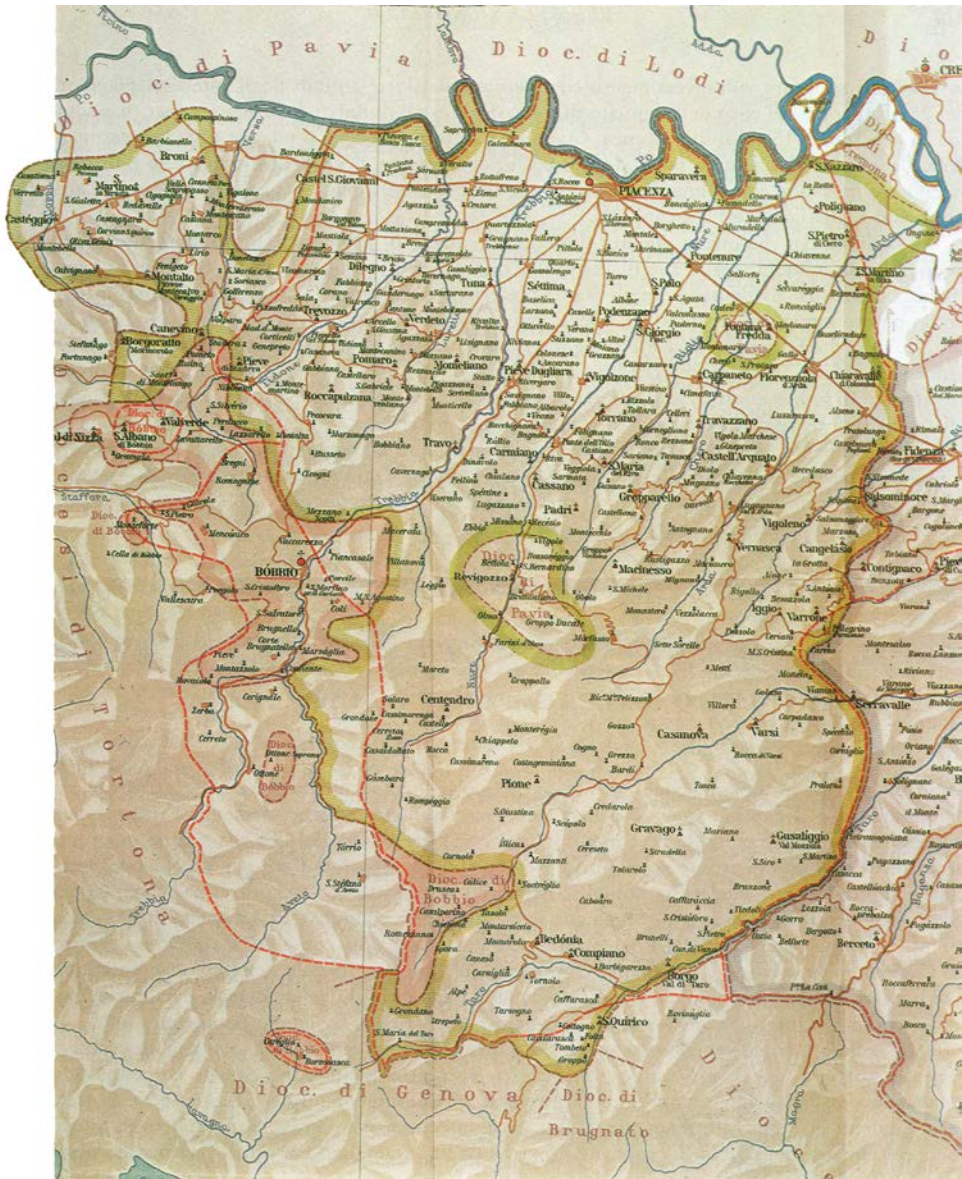
Fig. 2. I territori diocesani di Piacenza e Bobbio secondo le Rationes decimarum , Aemilia (1933).