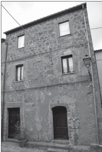
Prospetto Particolare 1