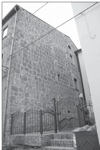
Prospetto Particolare 2