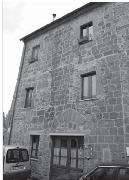
Prospetto Particolare 1

La particella catastale è una sola, ma comprende anche un altro edificio di epoca post-medievale.