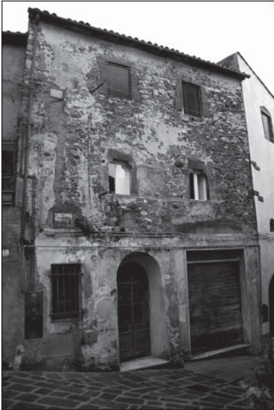
Prospetto Particolare 1

Corpo di fabbrica a pianta trapezoidale con prospetto visibile su via Roma e addossato ad altri edifici residenziali. Si conserva per tre piani di cui gli ultimi due con tracce di muratura medievale e due finestre (una reinserita). Il piano terra ha una scarpa di epoca moderna sul lato sinistro, ed è intonacato.