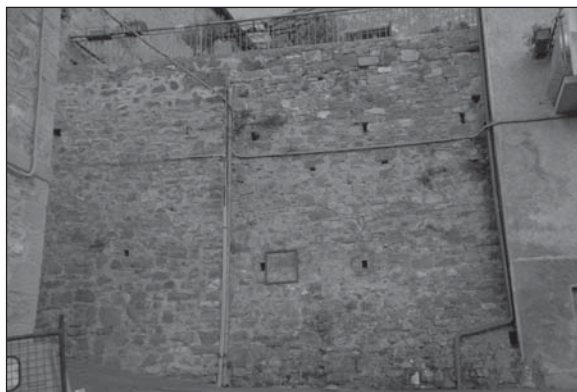
Prospetto Particolare 2

Arenaria (calcarenite) e calcare (fase 1)