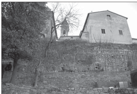
Prospetto Particolare 1

Proseguendo verso Nord, dopo il PP2, gli edifici attuali conservano probabilmente l'andamento del tratto di mura considerato fino a giungere alla Porta del Mercato, ma questo tratto, compresa la porta, si presenta interamente intonacato e non leggibile.