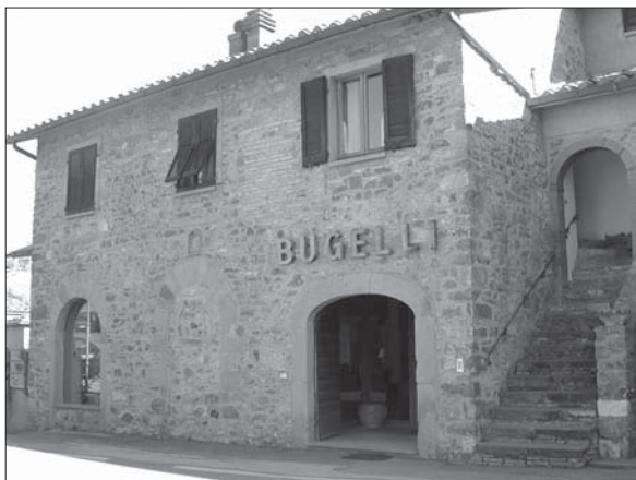
Prospetto Particolare 1

L'unica apertura originale è la finestra in alto a destra, sul Chiasso Largo, con una cornice in laterizi e l'arco a tutto sesto a doppia ghiera.