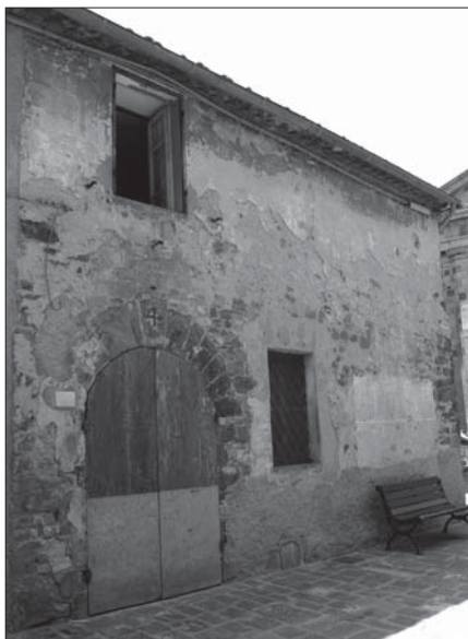
Prospetto Particolare 1

Il secondo prospetto è fortemente rimaneggiato e non conserva tracce visibili di murature medievali.