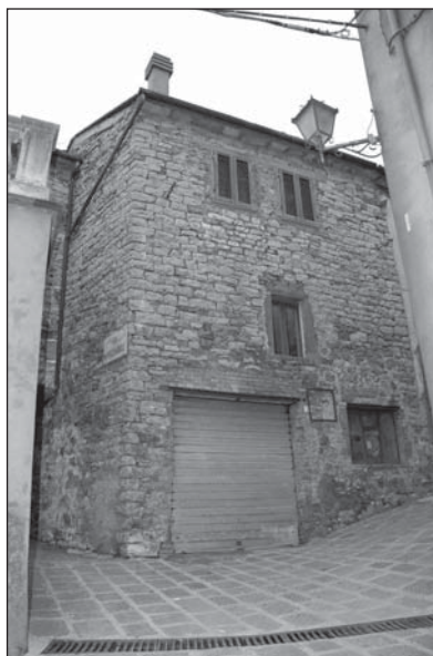
Prospetto Particolare 1

Si conserva l'angolata tra i due prospetti (con angolo superiore a 90°), mentre non si conserva nessuna apertura originaria.