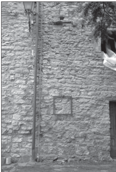
Prospetto Particolare 1

Edificio comprendente un tratto della cerchia muraria settentrionale, posto tra Via S. Francesco e Via della Ripa, dove si conservano le murature medievali visibili ai piani 1 e 2 del PP1, per un'altezza massima di m 6,20. Si conserva l'angolata sinistra (cui si appoggia CF6) che presenta conci aggettanti utilizzati successivamente per l'ammorsamento del CF6 (soluzione riscontrata anche nel borgo di Sorano).