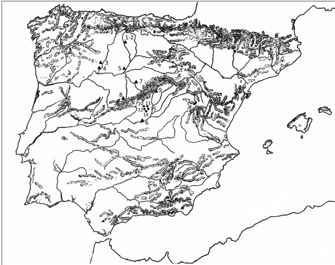
Figure 1. Map locating the sites mentioned in the text. 1-2 La Olmeda-Saldaña; 3 El Castellón (Sta Eulalia Tábara); 4 Cristo S. Esteban (Muelas del Pan); 5 Simancas; 6 Toledo; 7 Bernardos; 8 Navasangil; 9 Dehesa de la Oliva; 10 Villaviciosa de Odón; 11 El Soto; 12 El Pelicano; 13 Gózquez; 14 Torrejón de Velasco.