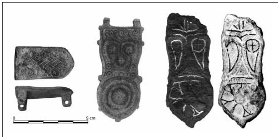
Figura 5. Personal objects from domestic contexts at El Pelicano.