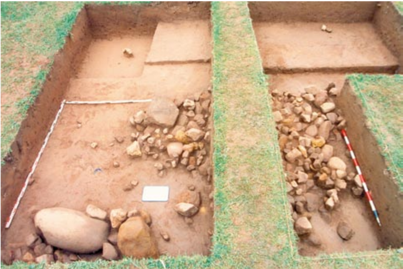
Figura 2. Excavación arqueológica: estructuras altomedievales.