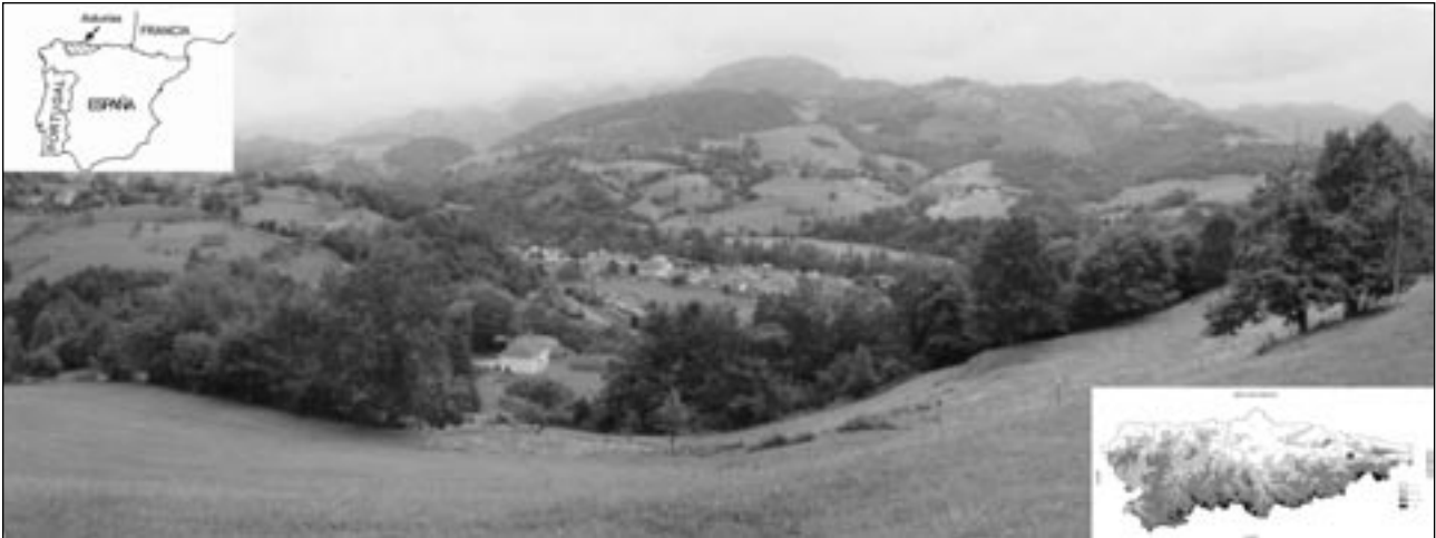
Figura 1. Localización y panorámica de la vega de Corao (Cangas de Onís, Asturias).